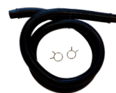
Tubes 2ml et raccords